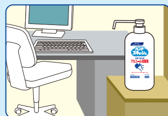
オフィス入り口に…