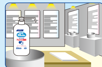
イベント会場の入り口に…