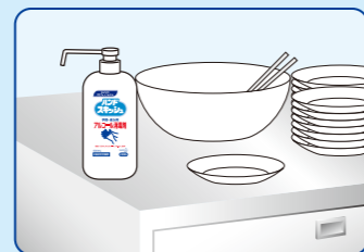
すぐ手が届く、作業台の上などに…(髪などにふれたとき)