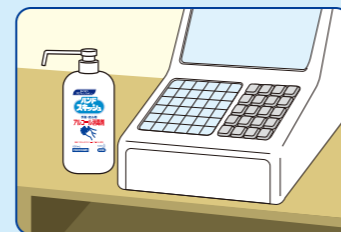
レジ等、お客様と接する場所に…